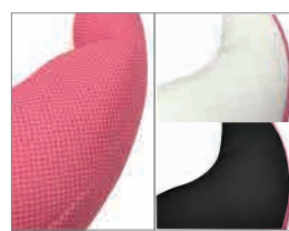
メッシュ素材 ストレッチ素材

メッシュとストレッチ素材の リバーシブルなので夏は涼しく 冬は暖かくご利用いただけます。 また、中身のビーズが取り出せる 2重カバー構造なのでカバーの 洗濯も可能です。